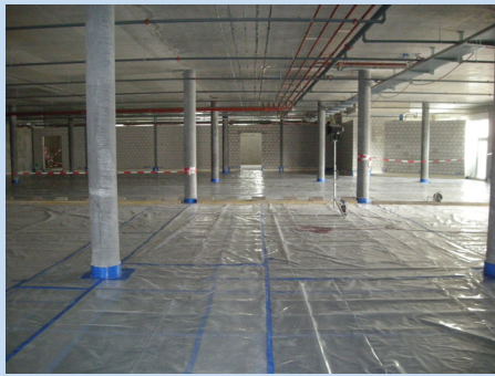
Flächenlagerung mit ISOPOL-Platten, mit PE-Folie abgedeckt