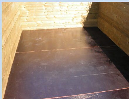
Innenraum vor Montage der Folie