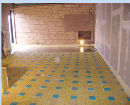
Raum mit Punktlagerung, Randstellstreifen ISOPE und Stahlblech-Abdeckung