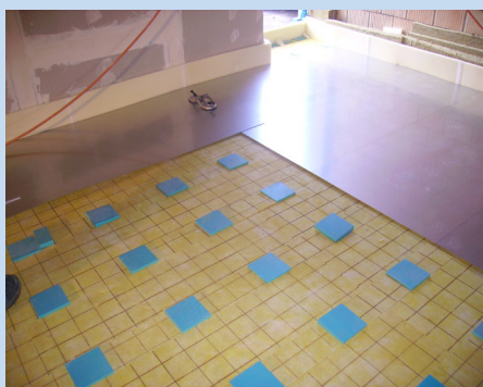
Punktlagerung mit ISOLMER-300

Weitere Informationen finden Sie auf www.hbt-isol.ch