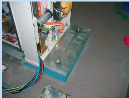
Gelagertes CT-Gerät nach dem Einbau des Sicherheitssystems