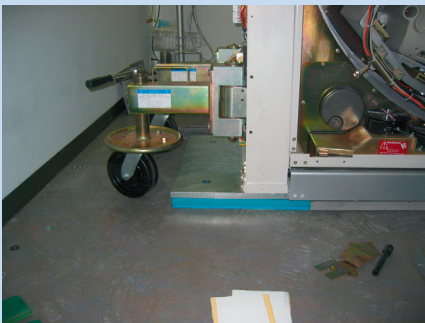
CT-Gerät mit eingebauter Lagerung