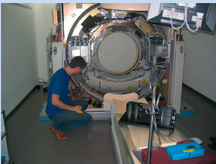
Justieren und Kalibrieren durch den Techniker